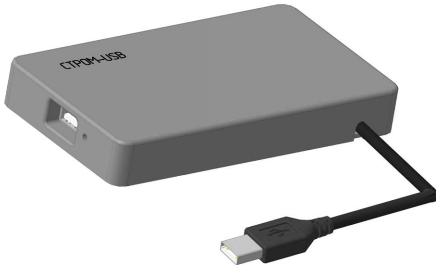
Рисунок 1 – Внешний вид изделия

1.4.1 Комплекс однонаправленной передачи СТРОМ - USB является функционально законченным устройством и реализует следующие функции: